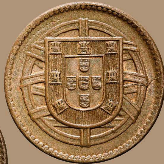
Seis exemplares conhecidos Six known specimens